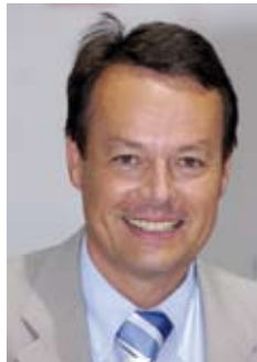
Klaus Tappeser, Präsident Württembergischer Landessportbund

Dienstleistungen, kompetentes Fachwissen und Beratung – beim 2. Servicetag Sport 2008 steht Ihnen die ganze Bandbreite des WLSB und seiner Kompetenzpartner zur Verfügung. Im Rahmen der ganztägigen Messe laden der WLSB und seine Partner im SpOrt Stuttgart zu Kontakt und Austausch ein. In den zahlreichen Fachvorträgen zu unterschiedlichen Servicethemen (siehe rechts) erhalten Sie gebündelte Fachinformationen aus erster Hand. Außerdem machen die